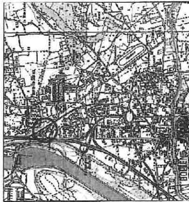
PLAN DE SITUATION - Echelle 1/25 000