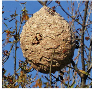
NID FRELON ASIATIQUE Implantation : 73% arbres à plus de 10 m 10% bâtiments, 3% haie Forme : sphérique à piriforme Ouverture : petite et latérale Taille : environ 60x80 cm

Le frelon asiatique pourra construire jusqu'à deux nids au cours d'une saison : un nid primaire et un nid secondaire. Le nid primaire est construit par la fondatrice en sortie d'hivernation. Il se situe habituellement à faible hauteur, dans des endroits protégés de la pluie et de taille relativement petite.