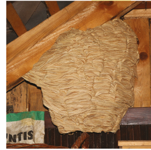
NID FRELON D'EUROPE Implantation : arbres creux, cheminées, rarement aérien Forme : cylindrique Ouverture : large vers le bas Taille : environ 30x60 cm