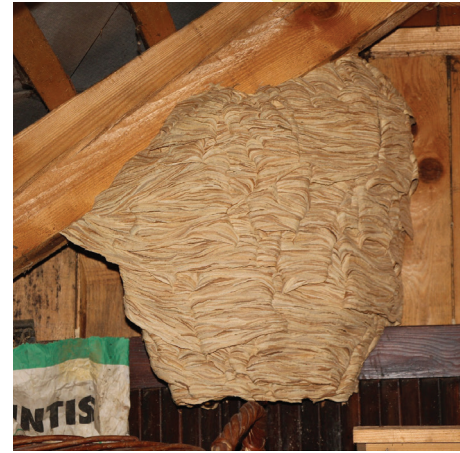
NID FRELON D'EUROPE Implantation : arbres creux, cheminées, rarement aérien Forme : cylindrique Ouverture : large vers le bas Taille : environ 30x60 cm